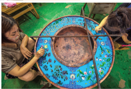
国家级文化产业基地安徽中粤金属集团