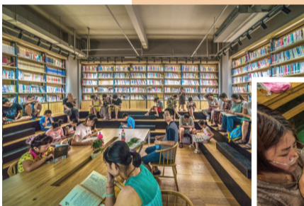
悦·书房罍街店内，市民畅游书海