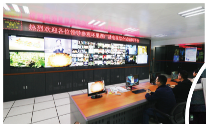
环巢湖广播电视台综合试验网平台