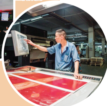
合肥市首批文化产业示范基地华云印务