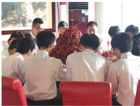
就喜欢这种实在的聚餐