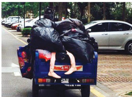
吓我一跳,差点就报警了