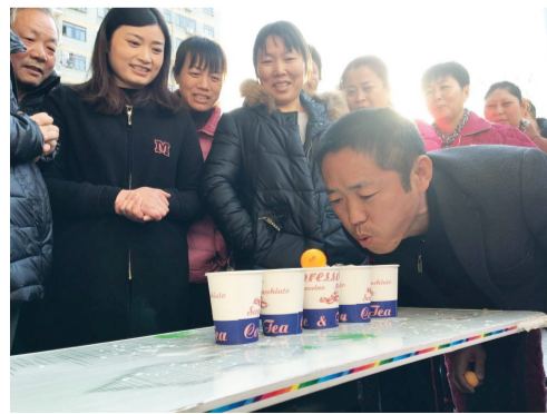
昨日,一场热闹非凡的邻里趣味运动会在合肥市岳西新村小区举行,50多位居民在各种比赛项目中一较高低。