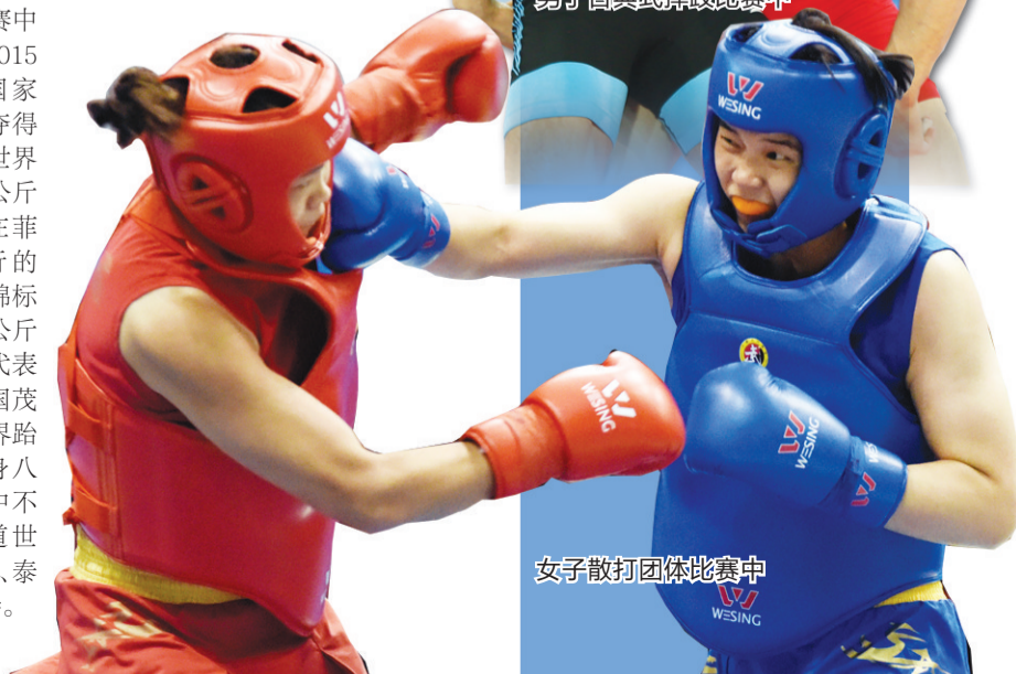
女子散打团体比赛中