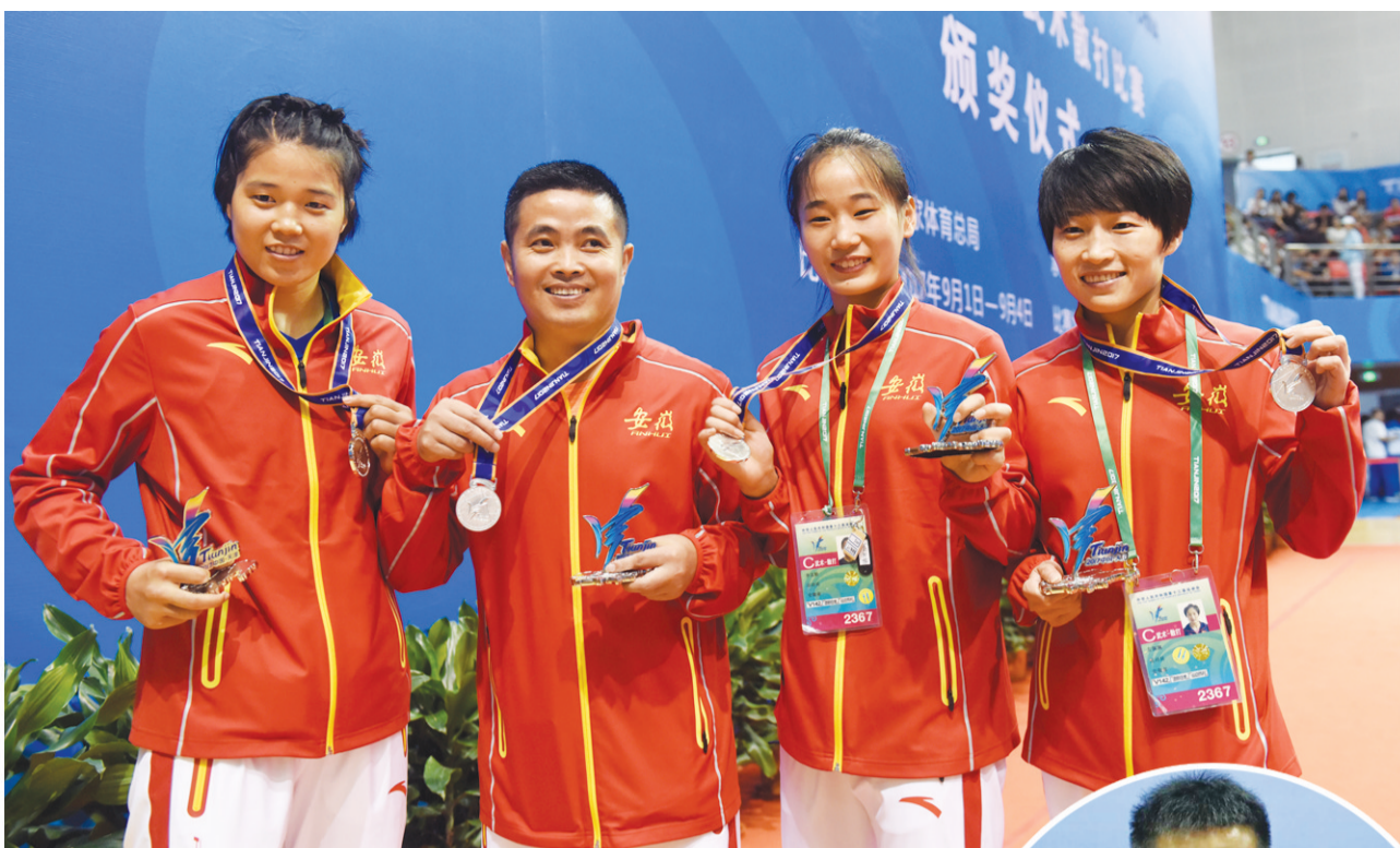
女子散打队员合影