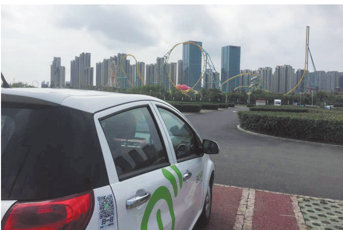
图为 EVCARD 在万达乐园附近网点