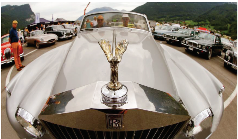
瑞士举行汽车集会 各式经典老爷车亮相

当地时间8月27日,瑞士Mollis,当地举办英国汽车集会,各式老爷车亮相。图为一辆劳斯莱斯。