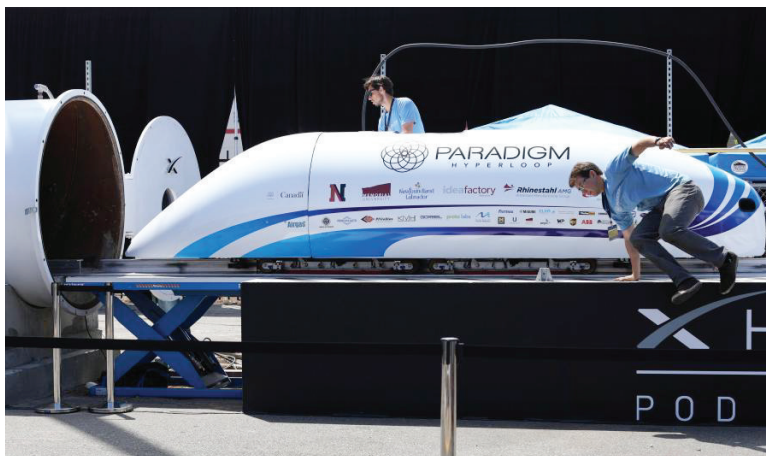
超级高铁列车比赛 全球逾20个团队参赛

8月27日,美国加利福尼亚州,全球逾20个开发超级高铁列车车厢的团队齐聚,在SpaceX的测试轨道上对它们的设备进行测试。 ■ 据中新社