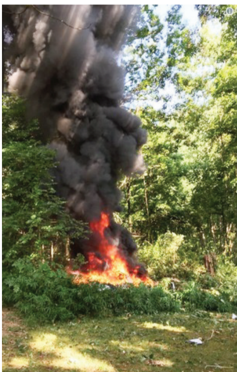
一架直升飞机坠毁

美国弗吉尼亚州夏洛茨维尔市12日的“另类右翼”集会引发暴力冲突，当地警方称目前至少3人死亡、35人受伤。