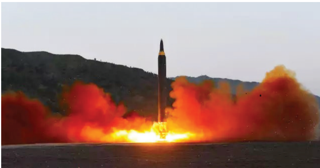
朝鲜洲际弹道火箭