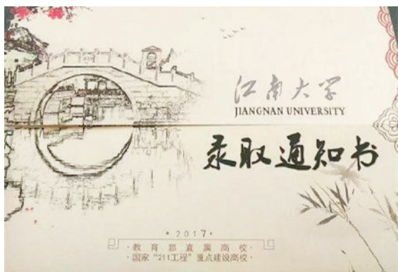
江南大学录取通知书