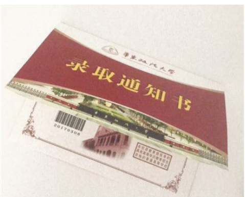
华东政法大学录取通知书