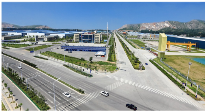
国家火炬杜集高端矿山装备特色产业基地

杜集区委区政府认真贯彻落实习近平总书记视察安徽重要讲话精神,围绕中国碳谷·绿金淮北发展战略,确立了建设改革创新先行区、装备制造集聚区、现代农业引领区、城乡统筹发展区、绿色生态示范区同步推进的基本路径。口子产业园、上海电气秸秆发电等项目开工建设,日前又成功与中国二十二冶集团签约项目合作,住宅产业化项目成功入驻。