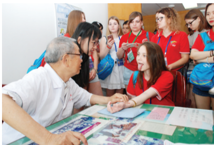
俄罗斯青年学生来院体验中医药疗法