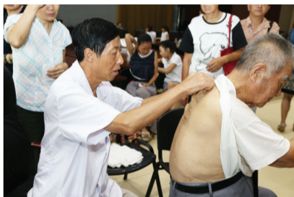
国家级名老中医魏福良“穴位敷贴”特色疗法