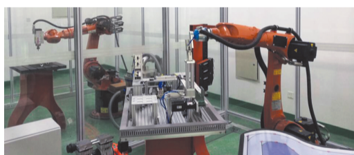
工业机器人实训室

高度重视项目建设，目前各项工作正在稳步推进。学校坚持以示范校建设为重点，创新人才培养模式，加强学科建设，推进教师专业化发展，全面提升教师的整体素质；坚持工学结合、校企合作，探索行业企业全程参与教育教学的机制体制，全面提高学生技术技能水平；不断创新学校管理模式，加强校园信息化建设，提升管理手段、提高管理效益。努力实现以抓招生稳办学规模、以抓培训变办学形式、以抓衔接升办学内容、以出精品显办学特色，逐步完成教学条件的提高、教学质量的提高、教师能力的提高、管理水平的提高、服务与贡献的提高。