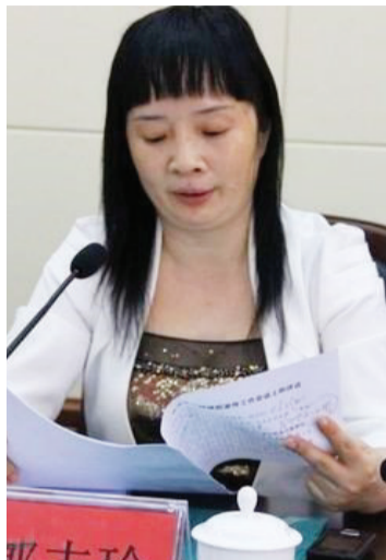
化州市委政法委原副书记郭志玲