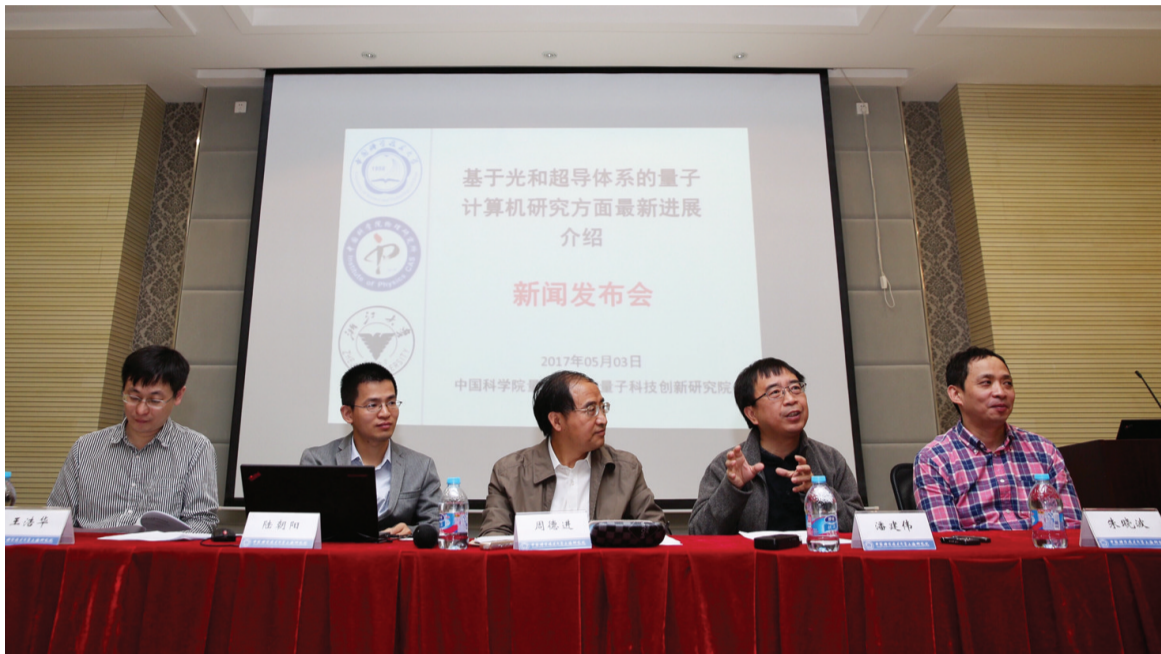
5月3日,潘建伟院士(右二)在中科院量子信息和量子科技创新研究院举行的新闻发布会上介绍“超导量子计算机路线图”。