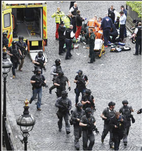
警察与救援人员在现场工作