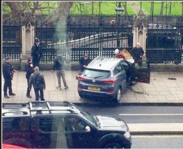
便衣警员持枪及时阻止了袭击者