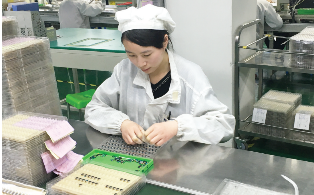
淮北金龙机电生产车间工人们正在忙碌