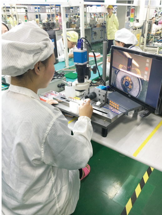
淮北金龙机电车间内