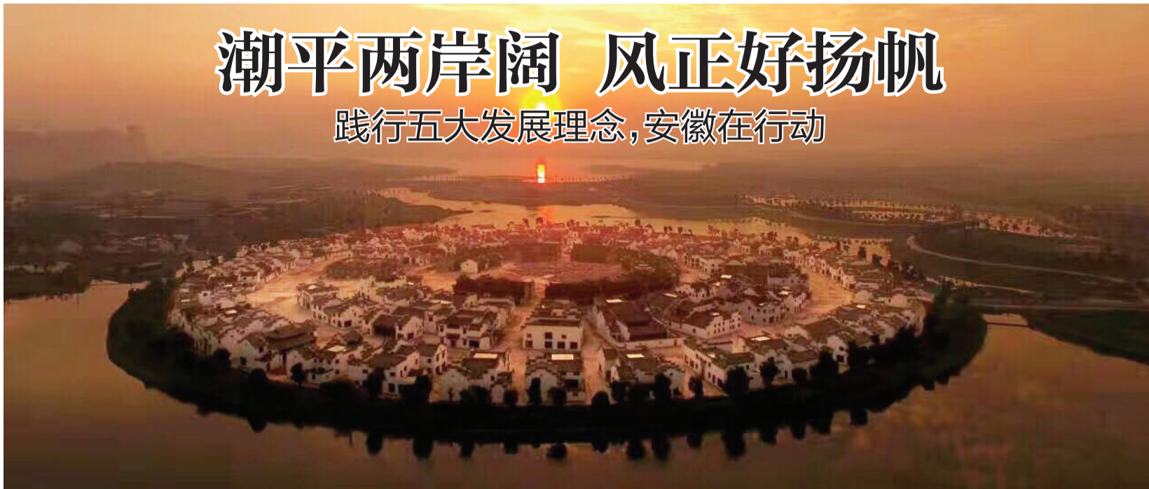
沐浴在朝阳中的珠城——蚌埠