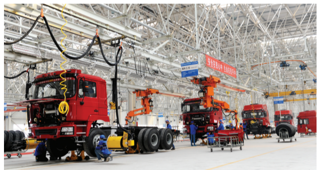
淮南经开区内,陕汽重卡新能源汽车生产线