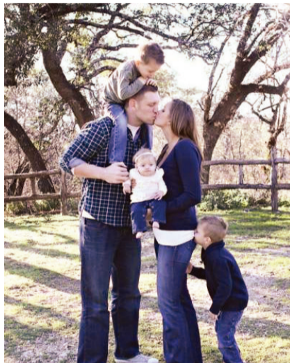
一家五口的幸福时光,只生三个好!