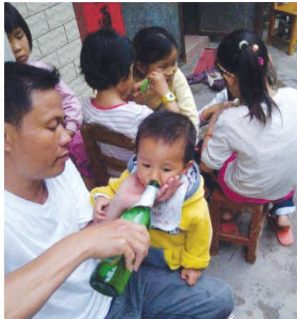
我有一个好爸爸,好爸爸!