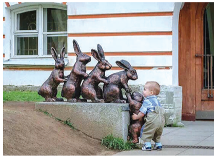
乐于助人的小朋友