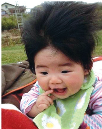
带孩子出去了一圈,发型嗷嗷的!