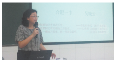
合肥一中名师来校做考前讲座

北城中学从建校的那一天起，便在教研上打了“漂亮的一仗”，逐步形成了“教风严谨积极，教研氛围浓厚”的“北城特色”：学校先是组建一支高素质教师队伍，继而帮助他们找准定位，最后为他们腾飞助一臂之力！老师们所有的努力最终都在学生们的高考成绩和综合素质中得到完美的呈现，学生们三年的发展轨迹正是学校教科研快速发展的有力证明。