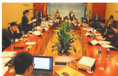
模联协会代表在第五届市会现场