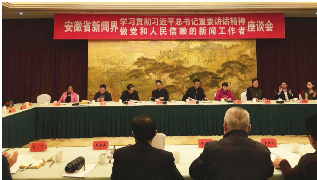
11月23日下午,安徽省新闻界在合肥天鹅湖大酒店举行座谈会,交流学习贯彻习近平总书记重要讲话精神心得,讨论如何做党和人民信赖的新闻工作者。