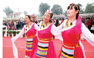
火红的日子舞起来