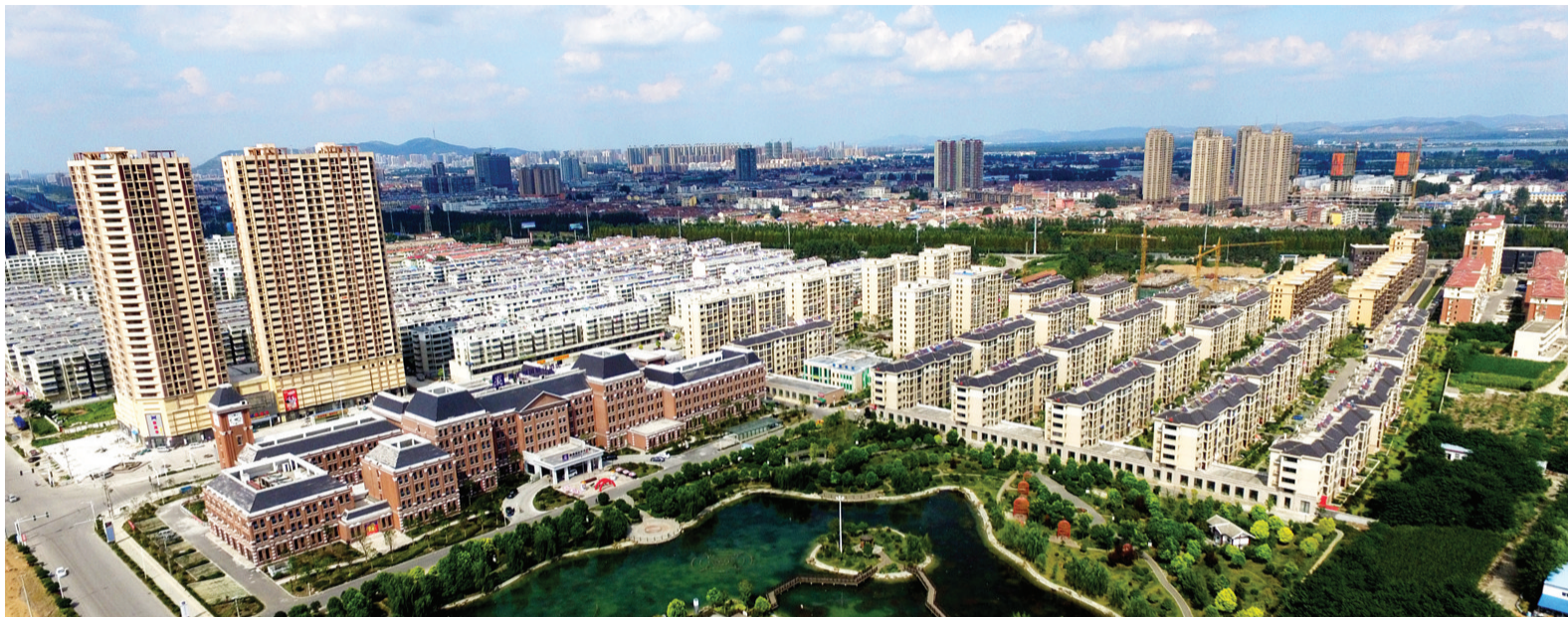
风景如画的濉溪新区一角