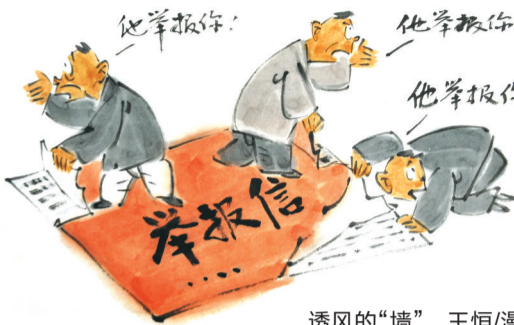
透风的“墙” 王恒/漫画

如此现实之下，难免让人追问：个人信息保护法呢？其实在这方面，我国一直在努力。早在2003年，国务院信息办就委托中国社科院法学所承担相关课题及草拟一份专家建议稿，课题组于2005年提交《个人信息保护法》专家意见稿。但时至今日，这样的法律，仍然是千呼万唤“不出来”。当个人的信息保护没有强有力的“法律屏障”，无论是举报人信息的泄密，还是公民活动中的各种信息泄密，不仅一直存在，而且愈演愈烈。