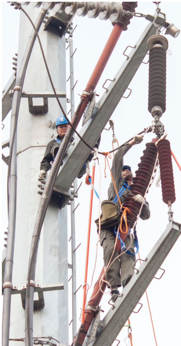
在线路上进行消缺工作