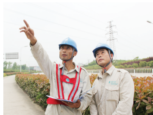
给同事指出新发现的线路安全隐患