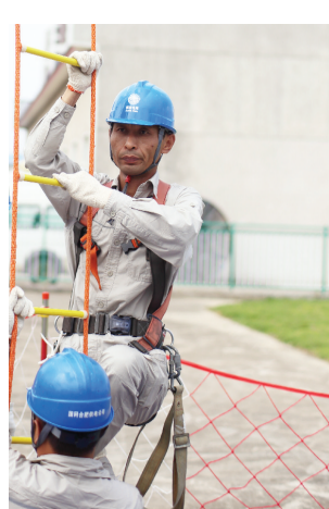
在现场试验刚研制的创新成果