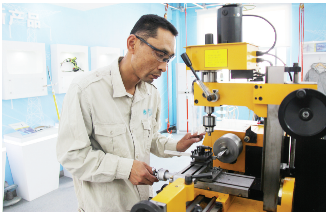
加工新改进的登高防护工具

“实现人生的价值,是每个人的梦想和追求,线路工干的是万家灯火的事业,我和线路有感情,还要再干二十年,当好银线卫士”,他的铮铮誓言让我们看到了一个新时期电力工匠的风采。 ■ 刘爱兵 本报记者 文/图