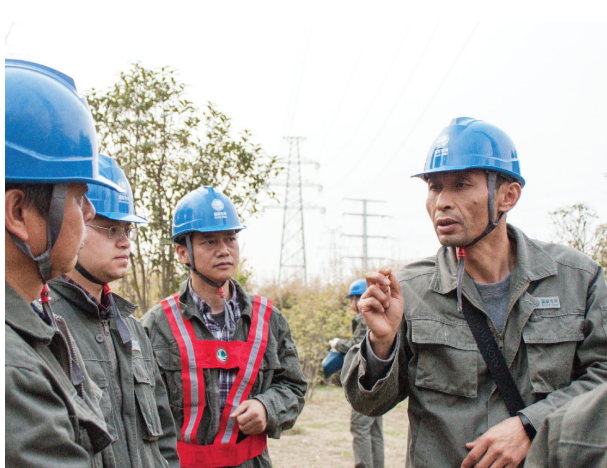
给班组人员讲授安全要领