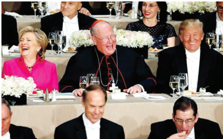
两党候选人隔着大主教就坐参加慈善晚宴,是美国大选多年来的传统。