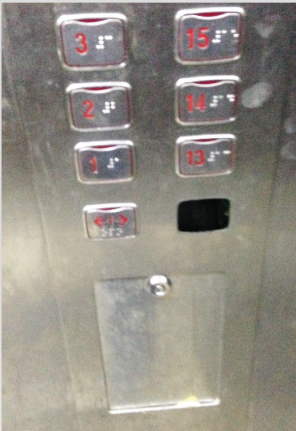
玫瑰绅城C区4号楼的电梯连闭合按钮都遗失,竟然还在运行