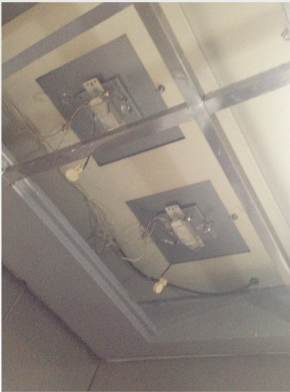
马鞍山路珠光花园二期的电梯,顶板裸露