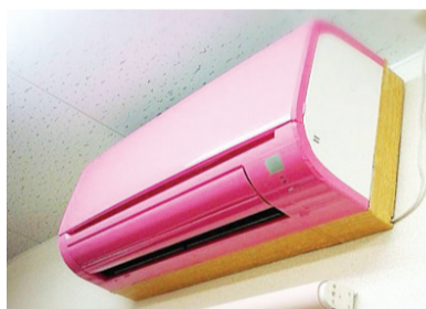
粉嫩系空调,看得我晕乎乎的