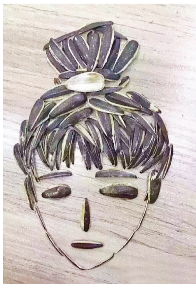
艺术家吃瓜子都这么牛