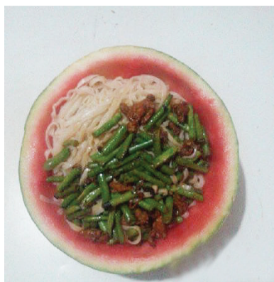
西瓜捞面条,好吃,好爽