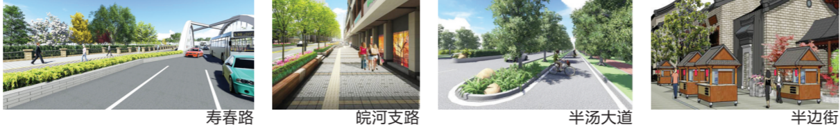
寿春路 皖河支路 半汤大道 半边街