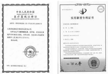
医疗器械注册证 重大发明专利证书

小腰带中的航天纳米纤维就像一部焊接机，能发射出8-15纳米的能量光波，焊接愈合纤维环裂口，从根本上治好腰椎病。