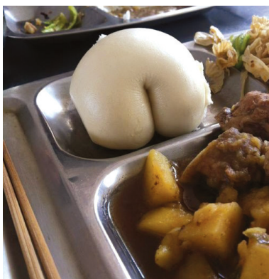
性感小屁屁,好想亲一口。