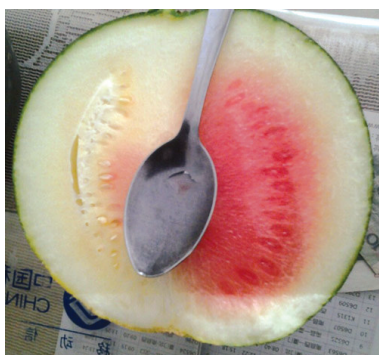
卖西瓜的,别走,看我打不死你。