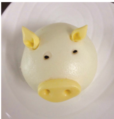
爱心便当,小猪馒头。