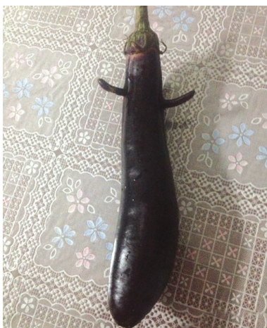
主人,下锅前,请再给我一个拥抱吧!