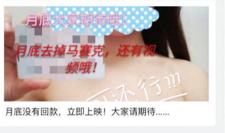
月底没有回款, 立即上映! 大家请期待.....