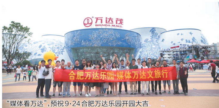
“媒体看万达”,预祝9·24合肥万达乐园开园大吉。

为了更加直观地感受万达文化旅游项目的魅力,提前体验合肥万达乐园9月24日开业后的盛况。5月26日~29日,二十多家主流媒体踏上已于去年9月26日开业的西双版纳万达国际度假区体验之旅,并见证了南昌万达乐园的盛大启幕。“将世界先进娱乐科技与项目落户地区优秀文化完美融合;让乐园涵盖吃、住、行、游、购、娱一站式全景服务”。快乐需要分享,那就通过wuli思聪的直播平台,和手机前数十万观众一起感受肆无忌惮的畅爽。