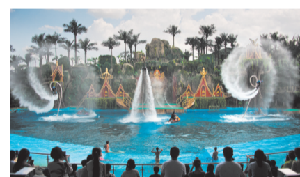
西双版纳万达国际度假区大型水上特技实景秀—《翡翠人鱼》表演