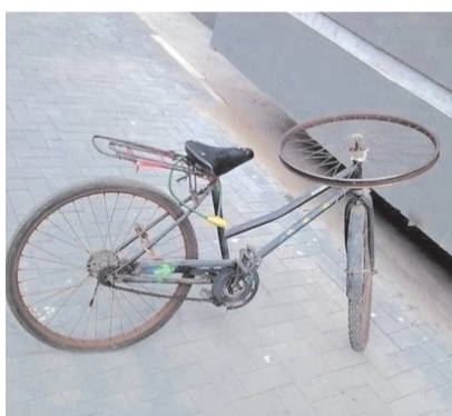
骑自行车让你有开车的自信