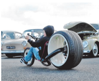
我靠，你后轮胎是原装的吗？