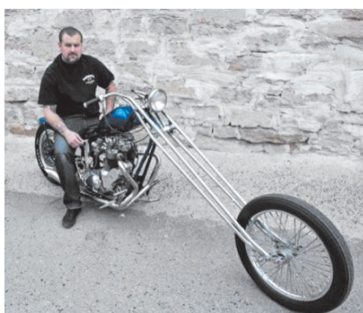
想提升车身长度，也不用这么改吧