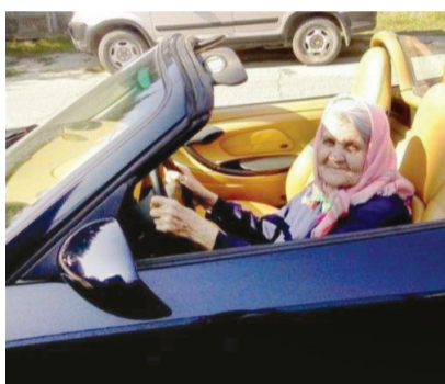
老太太，你的座驾真拉风