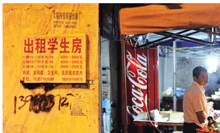
镇上随处可见的出租学生房广告，其中在毛坦厂中学正门附近的租金最贵