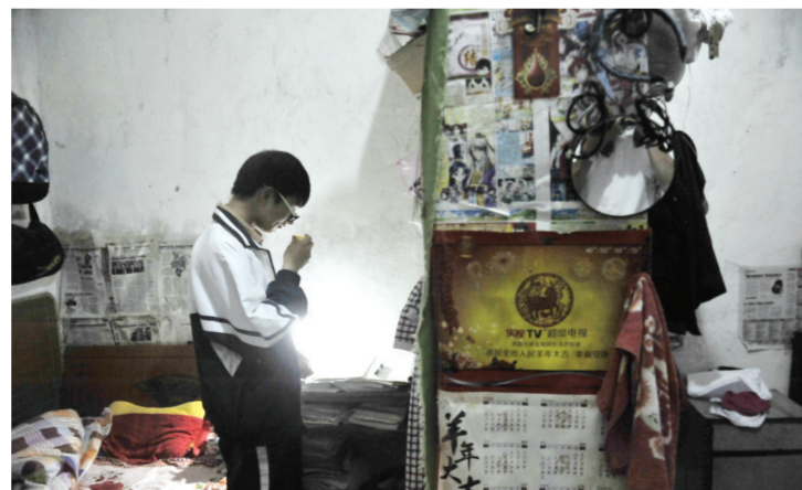
考生住在条件相对简陋的出租房