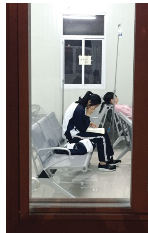
学校内的保健室，一名毛坦厂中学的学生一边挂水一边看书复习