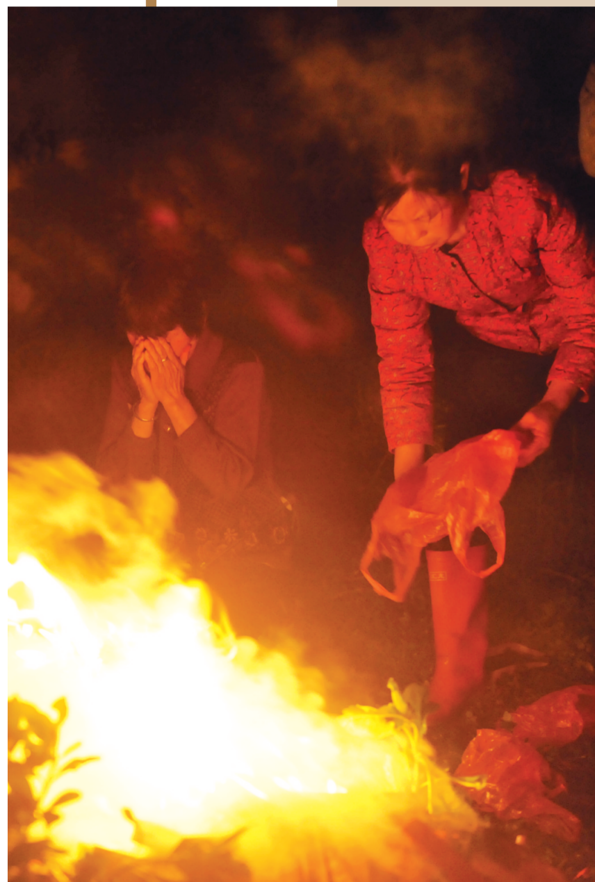
21日是高考前的最后一个阴历十五，陪读家长们在学校“神树”旁抢烧头香