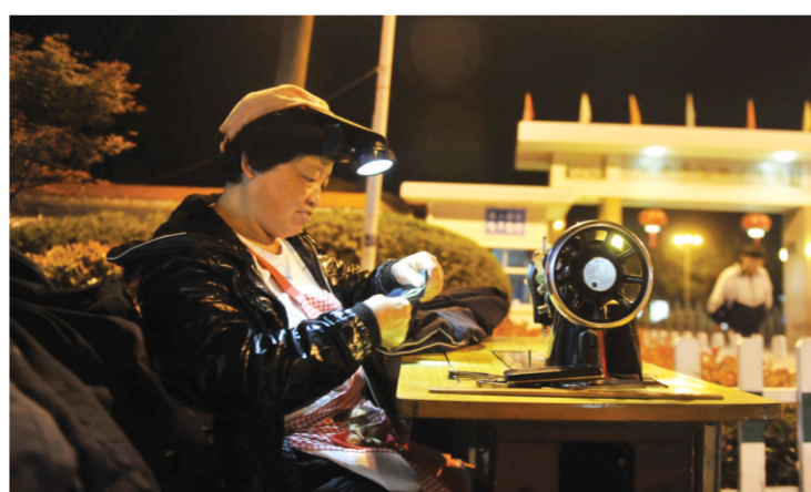
一名陪读母亲在孩子毕业之后留在毛坦厂，在学校门口摆起摊替学生们缝补校服