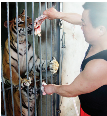
驯兽师给老虎喂食