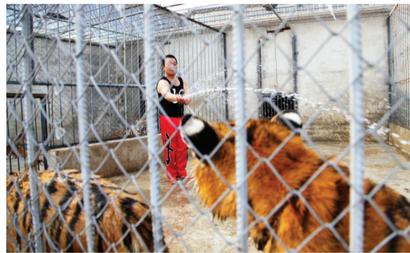
驯兽师每天都要为老虎洗2次澡