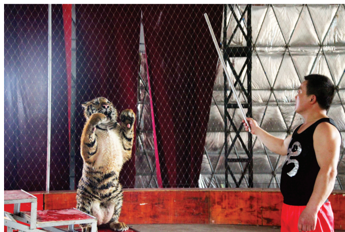
除了表演，每天还要对老虎进行训练