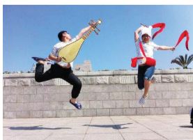
网友:我毕业了,庆祝一下。 大神:咱老百姓今个真高兴。