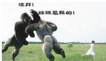
网友:背景空旷,求一个宠物追我! 大神:一下给你两个,满意不?