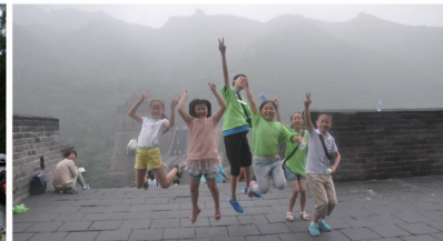
历届活动照片回顾