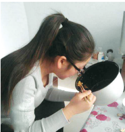
这样的媳妇养不起啊