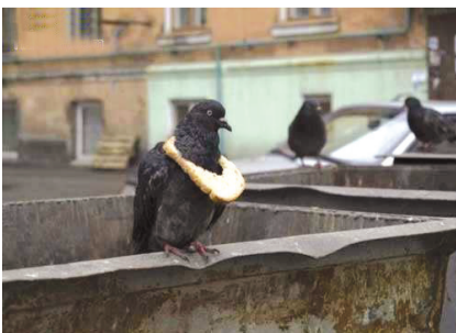
原来鸟类也有画饼充饥一说啊