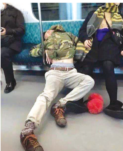
我去，这是困成什么样了啊