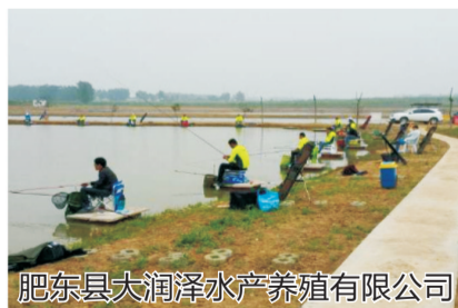
肥东县大润泽水产养殖有限公司

肥东县大润泽水产养殖有限公司位于肥东县杨店乡杨店社区，拥有养殖塘口面积240亩，青虾、龙虾养殖60亩和肥东县第10大水库小一型大李水库，水库总库容631.4万立方米，有效灌溉面积1千公顷，可蓄水面3420亩，可养殖面积1260亩，为乡镇自来水供应的取水处，水质优良无污染。主要养殖鲢鱼、鳙鱼、鲫鱼、草鱼、黄颡鱼、鳊鱼、青虾、龙虾等淡水鱼虾，年产优质商品鱼虾100多吨，年产值260万元。示范带动本地10平方公里范围的水产养殖，被认定为合肥市健康水产养殖示范场。开发水库浮桥、池塘及龙虾等特色休闲垂钓。旗下投资建设“肥东大润泽生态农庄”项目，拥有果园20亩，有葡萄、桃、枣等可采摘，林中养鸡。拥有餐厅10间300平方米，日接待能力300人，有自产自销