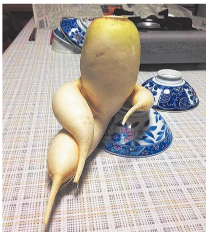
销魂的白萝卜,小妞,跟爷唱歌曲儿吧