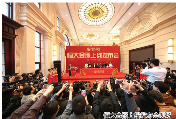
恒大金服上线发布会现场

“2月份银行理财和互联网宝宝产品的平均收益率仅略高于4%。”一位业内分析师表示,“相比之下,恒大金服首批产品的最低年化收益率为6.3%,最高可达8%,具有较强的吸引力”。