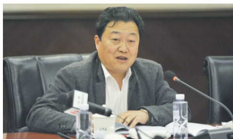
展情况，找准城市发展急需工种，本着“缺什么、培什么”的原则，有的放矢，培企业之所需，教农民之所需。

夏玉发建议，既要因地制宜解决一部分不适宜外出就业农民的就业困难，更要解决多数中青年农民的转移就业问题，对照当前城市发