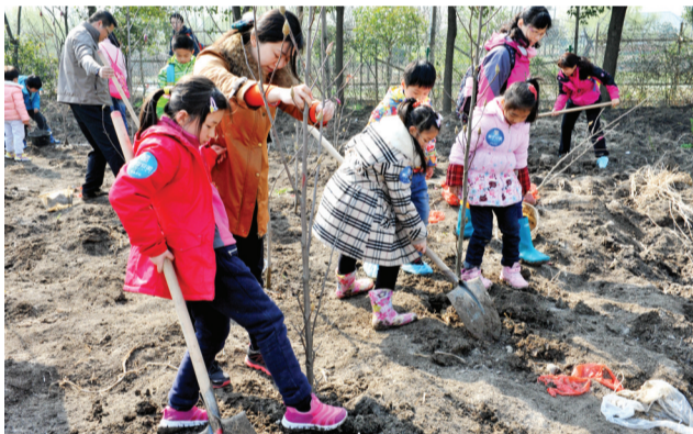
小记者们正在植树