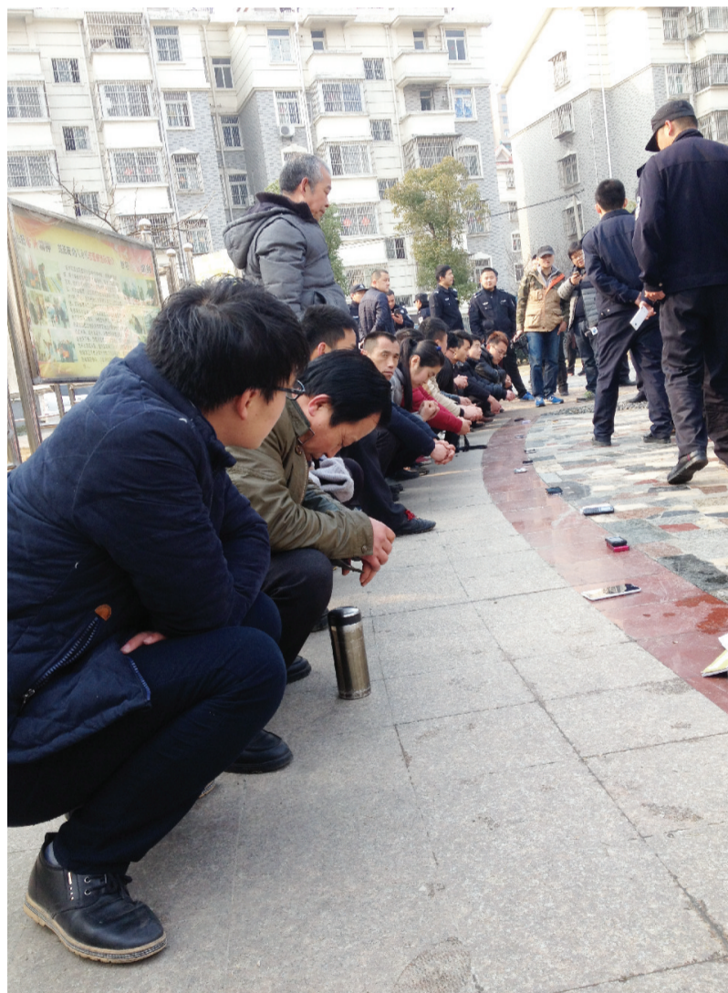
包河花园被查到的传销分子