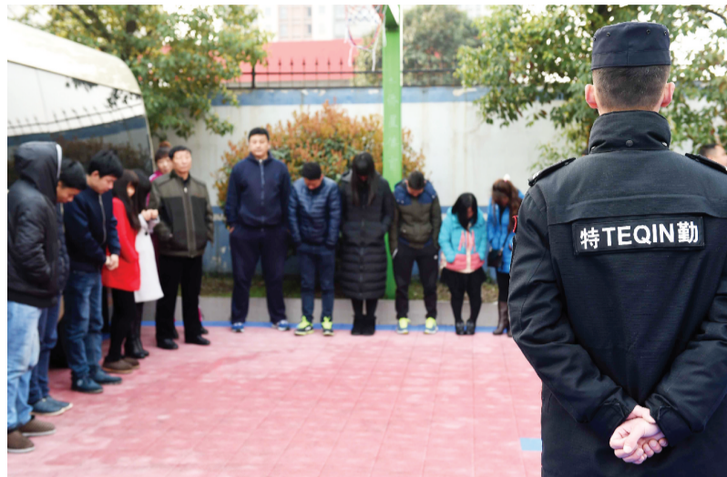
瑶海区传销人员被集中在一起

一位执法人员说:“他们的反侦察能力确实很强。此次,我们是通过居民举报,进行过前期多次的摸排和走访,确定了具体位置,选择在早晨这个容易放松警惕的时段展开行动,收效还是很明显的。” 记者 祝亮