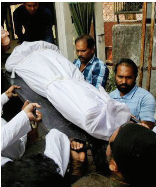
医务人员和当地人在凶案现场处理尸体

美国枪支泛滥,枪支数量与人口总数相当,每年大约3万人死于枪下。支持控枪的机构弗吉尼亚公共安全中心今年1月说,1963年至今,全美死于枪口下的人比死于战争的人还多。 据新华社