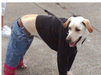
现在当条狗也挺不容易的