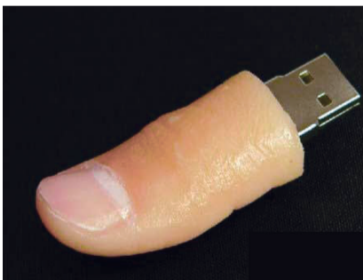
这个优盘你敢用吗