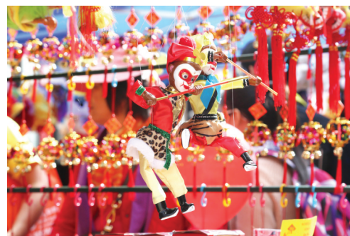
2月20日,为期两天的美国旧金山市唐人街元宵街会开幕,吸引了大批市民、游客前来选购中国特色商品,感受中国春节民俗。