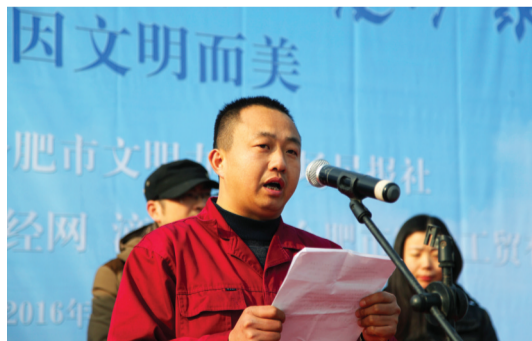
出租车驾驶员代表宣读“文明驾驶 温暖服务”倡议书