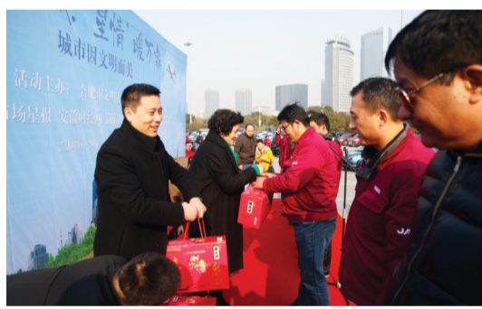
主办单位领导为出租车驾驶员代表发放新春大礼包