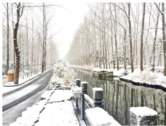
合肥滨湖湿地公园雪景