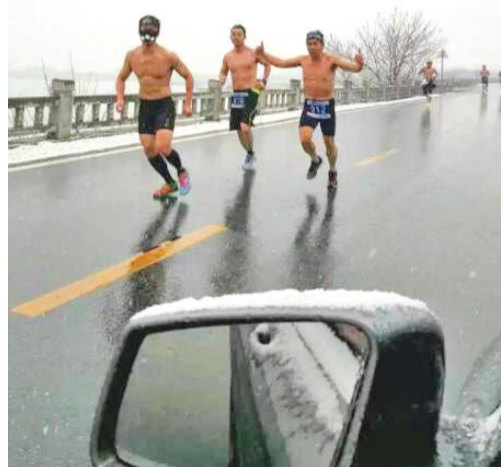
昨天下午,巢湖市雪花漫天飞舞,在滨湖大道上,三位男子身穿短裤,赤裸上身,在风雪中奔跑。