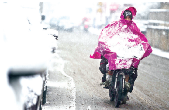
昨日下午,合肥大通路,市民在大雪中艰难骑行