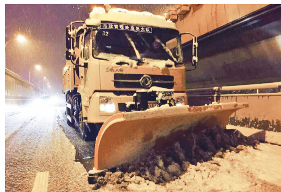
合肥市政工程管理处应急人员在撒融雪剂。