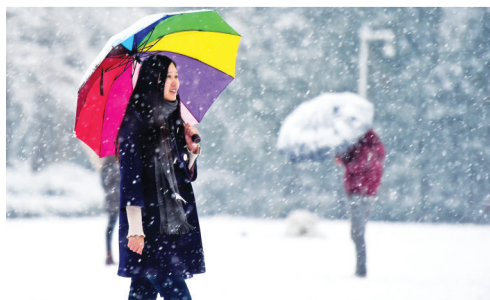
合肥逍遥津,美女看雪