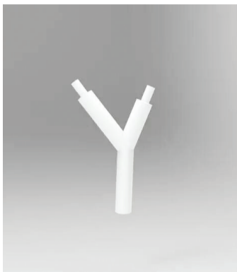
《关于整个世界的小说》