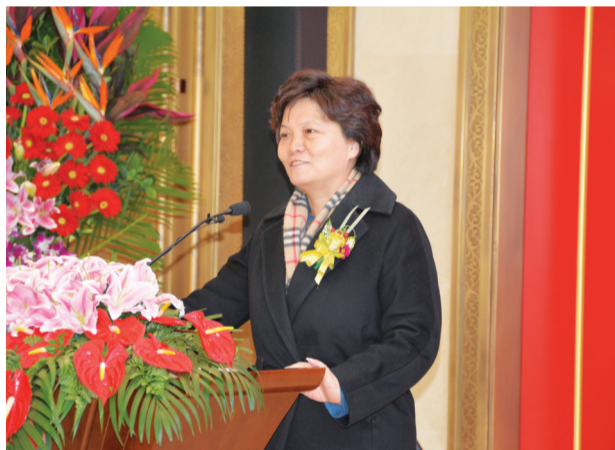
芜湖市委常委郝芳华女士出席挂牌仪式并发表贺辞