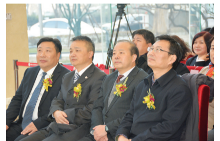
芜湖市、南陵县领导出席挂牌仪式

为进一步健全和完善地方金融体系,充分利用多层次资本市场,拓展融资渠道,从智力市场转向资本市场,根据“新三板”挂牌要求,结合该公司实际情况和前期整合,2015年12月4日挂牌“新三板”,成为芜湖市第一家农业类上市公司。