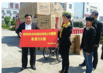
雨田润公司向社会做贡献