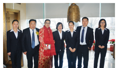
出席挂牌仪式公司员工